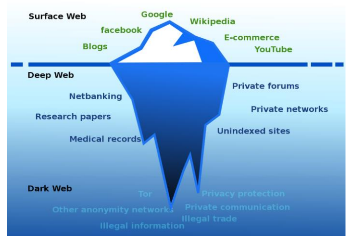
Gambar 2.1.1 Ilustrasi metafora Clearnet dengan Deep Web